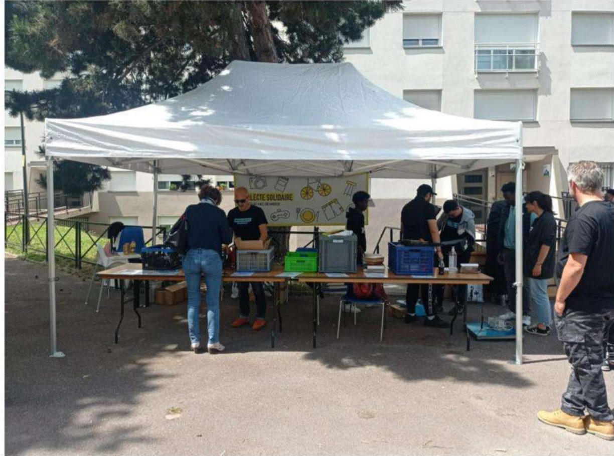
Collecte – Espérance – 25 mai

Notamment grâce aux jeunes du chantier éducatif, plusieurs collectes à domicile ont été effectuées pour aider les personnes à mobilité réduite à transporter leurs objets jusqu'au lieu de collecte.