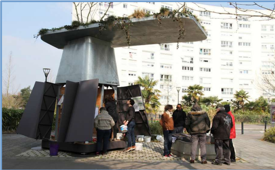
Le composteur collectif installé quartier Malakoff à Nantes

Nantes Métropole avait déjà travaillé avec ce duo de créateurs sur la conception d'un composteur collectif et a décidé de renouveler le partenariat en finançant un prototype.