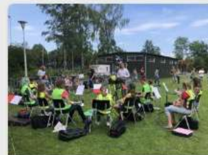
Een muzikale opruimactie met Brassband Pro Rege