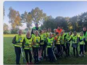
Inwoners Hoornsterzwaag supportten OBS It Bûtenplak