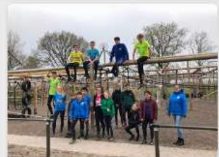
Run op zwerfafval in de Knipe!