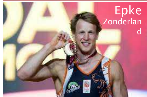
Epke Zonderlan d