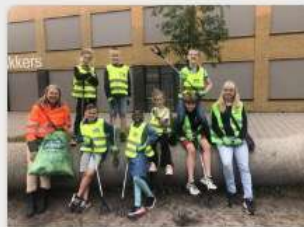
Winkelcentrum de Akkers knapt op door OBS Route 0513