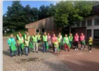
Samen op pad in Haskerdijken en Nieuwebrug