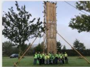
Polaris 'scout' zwerfafval met gemak!