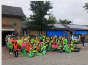
OBS Sevenaerschool in Nieuwehorne