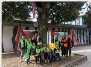
KC Skoatterwiis in Oudeschoot: als rovers door de struiken