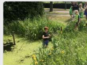
Verfrissende beloning na warme opruimactie