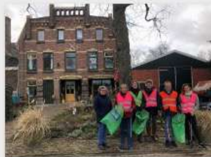
It Pakhûs zet zich in voor een schoon Akkrum!