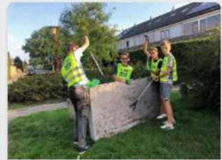
Afbraaktijden van zwerfafval?