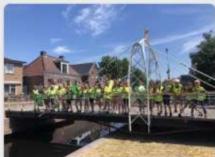
OBS De Boarne zet zich in voor een schoon Aldeboarn!