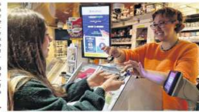
Les cendriers sont distribués gratuitement par les buralistes de Versailles dans la limite des stocks disponibles.

La Ville a ainsi fait appel à Alcome et aux buralistes pour lutter contre les mégots de cigarettes jetés dans ses rues. « Alcome est un éco-organisme chargé par l'État de réduire de 40 % les mégots dans les rues d'ici 2027, résume Pierre-Etienne Delfy, responsable de