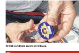
10 000 cendriers seront distribués.