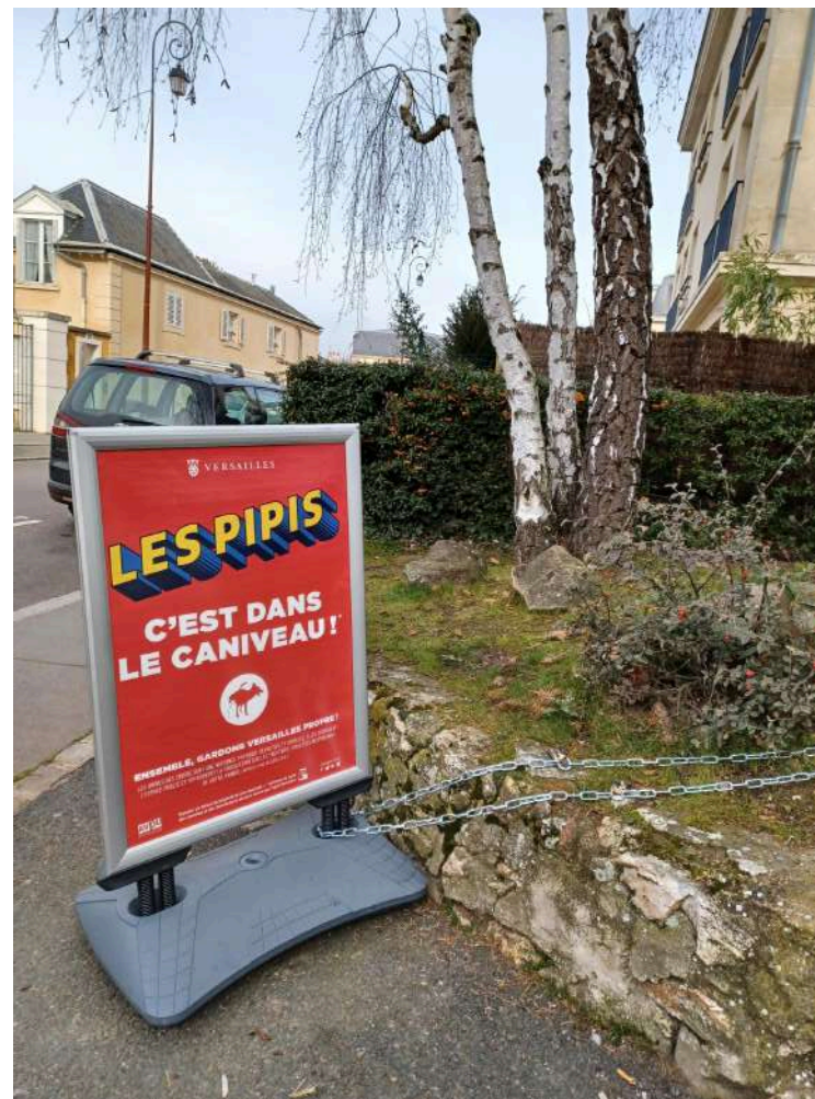
Les PIPIS, c'est dans le caniveau