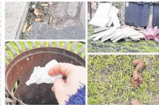
Chaque année, la Ville lance une campagne de communication sur la propreté pour que chacun respecte l'usage de l'espace public.

À titre d'exemple, en 2022, près de 1 400 constats de non-respect du règlement de collecte ont été effectués. 970 lettres de rappels de consignes ont été envoyées et 240 facturations de frais d'intervention (98 €) des services municipaux délivrées. « Les sacs d'ordures ménagères doivent être sortis les jours de collecte, aux horaires prévus, rappelle Carine Pelletier-