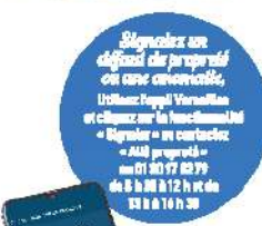
Versailles Magazine | Février - mars 2023

Participer à la propreté de votre ville en utilisant les services de la Ville.