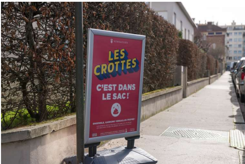
Les CROTTES, c'est dans le sac