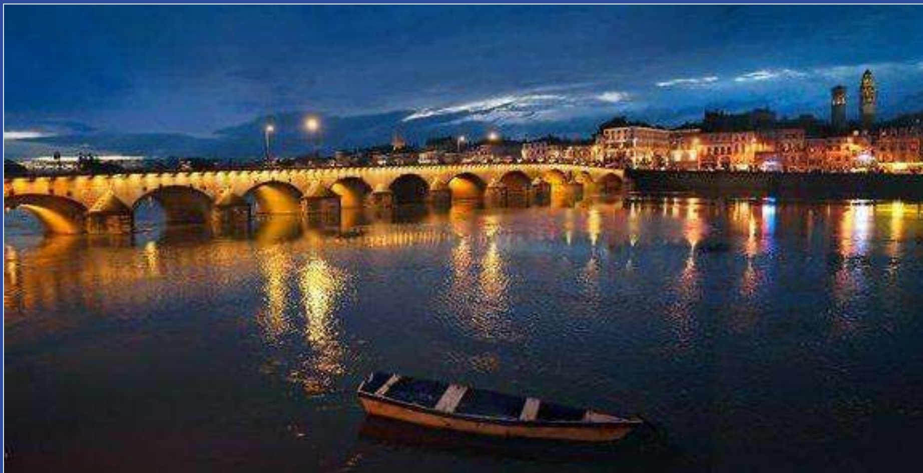
Vue nocturne sur la Saône