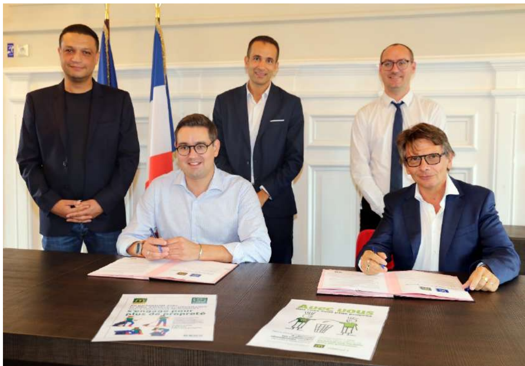
Signature de la convention entre Mr le Maire et Mc Donald's le 13 septembre 2023

Ces actions nous ont permis de créer des liens privilégiés avec des entreprises locales pour permettre la mise en place de partenariats pérennes : Une Convention signée avec le restaurant Mc Donald's (1 ère signature de ce type dans l'Eurométropole de Strasbourg) apporte la première pierre pour qu'ensuite d'autres entreprises suivent à Illkirch-Graffenstaden.