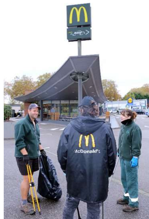
Action immédiate : synergie entre les agents de la collectivité et ceux du restaurant