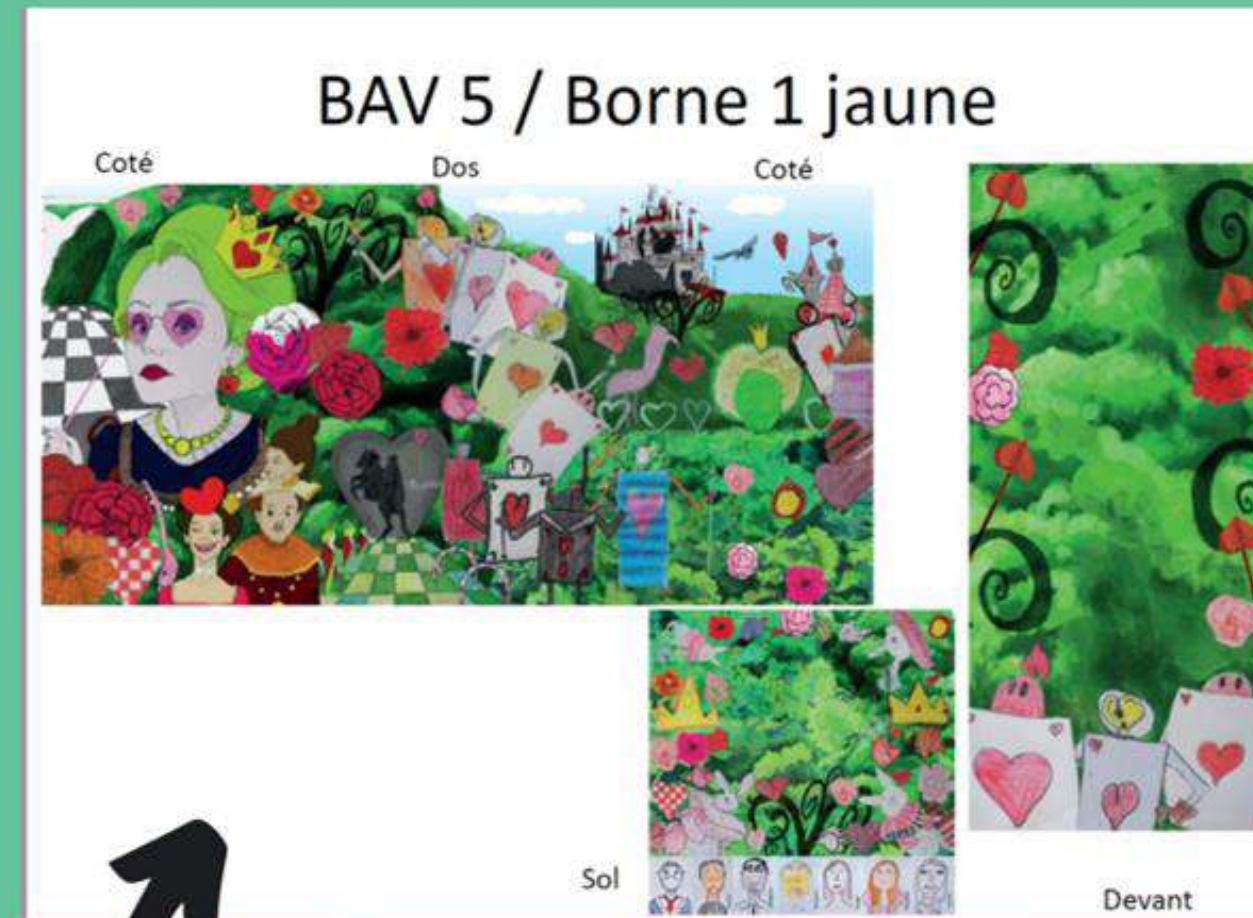
Une conception de l'artiste ELISA LEWIS, autour du thème d'Alice au Pays des Merveilles, élaborée avec la classe CE2-CM1 de l'école Georges Braques