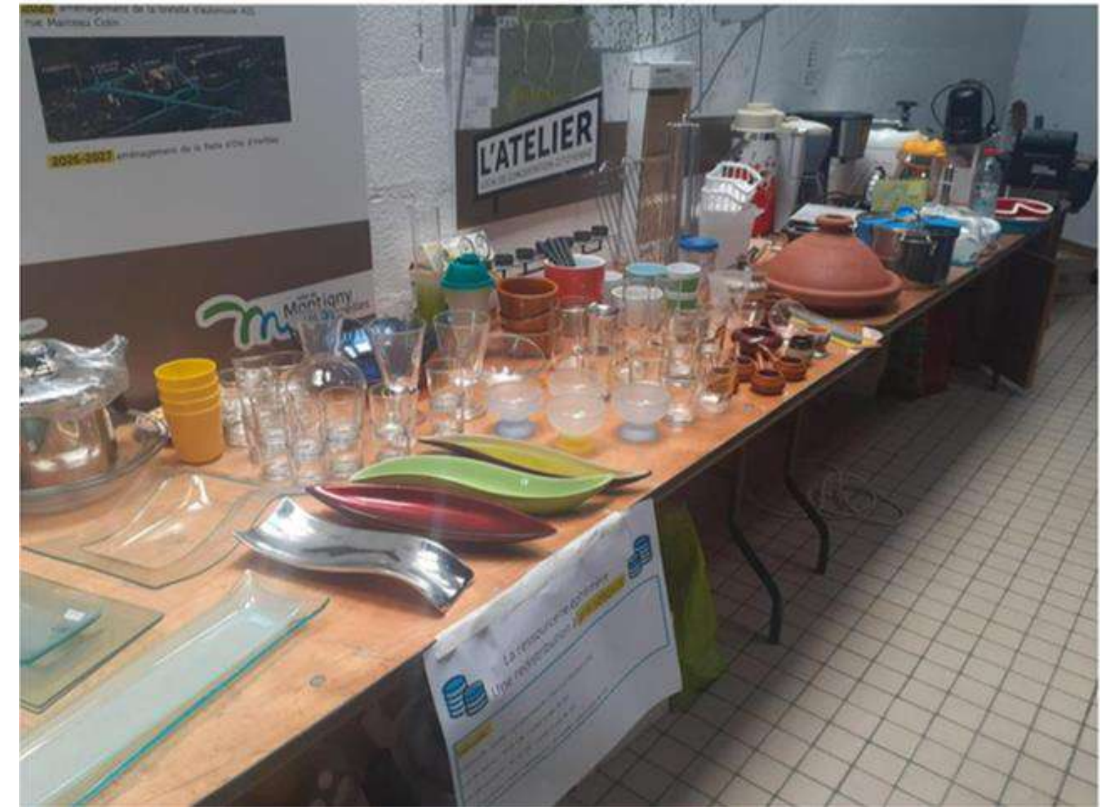
Objets collectés et vendus pendant une boutique solidaire