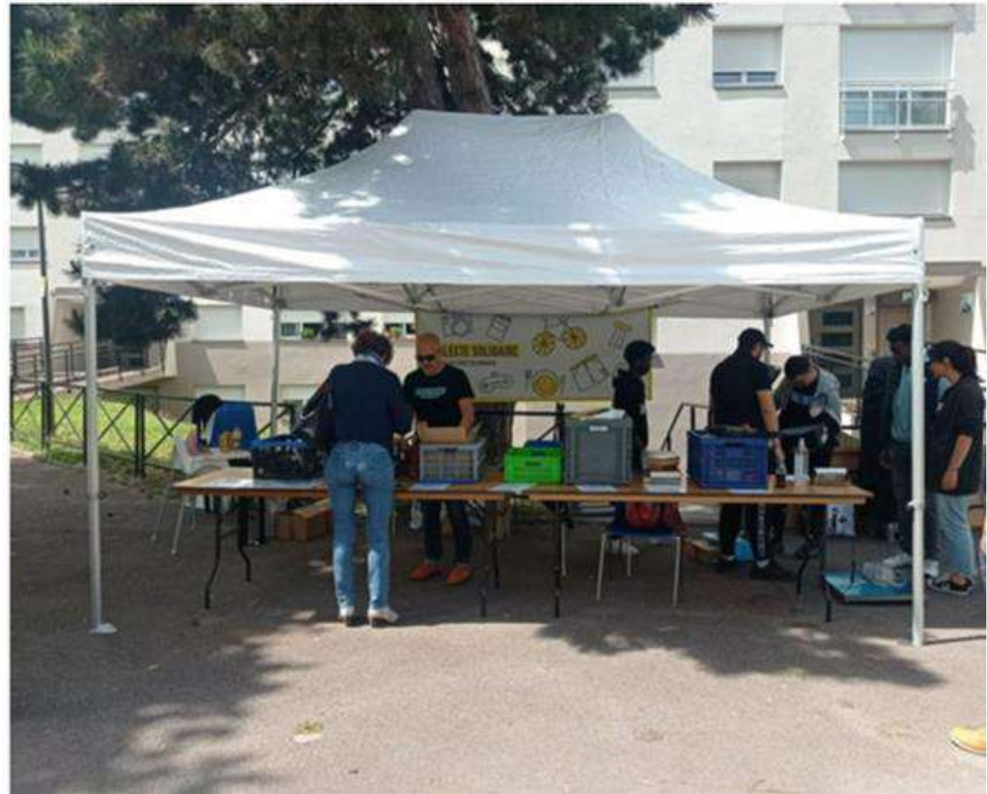
Collectes en pied d'immeuble dans les quartiers