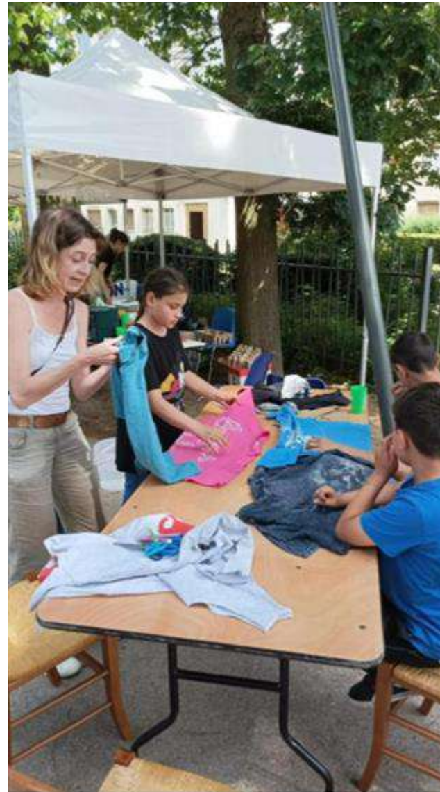
Ateliers du réemploi