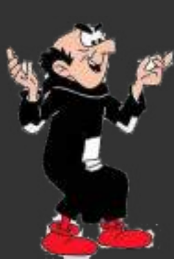
Le responsable de service