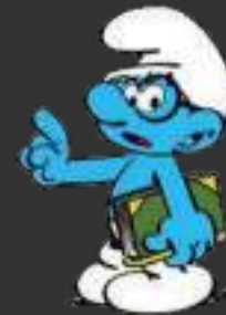
Le psychologue / ergonome