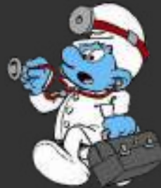
Médecin du travail