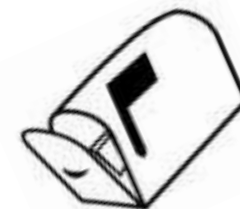
Format des avis : A5 (21cm x 15cm)