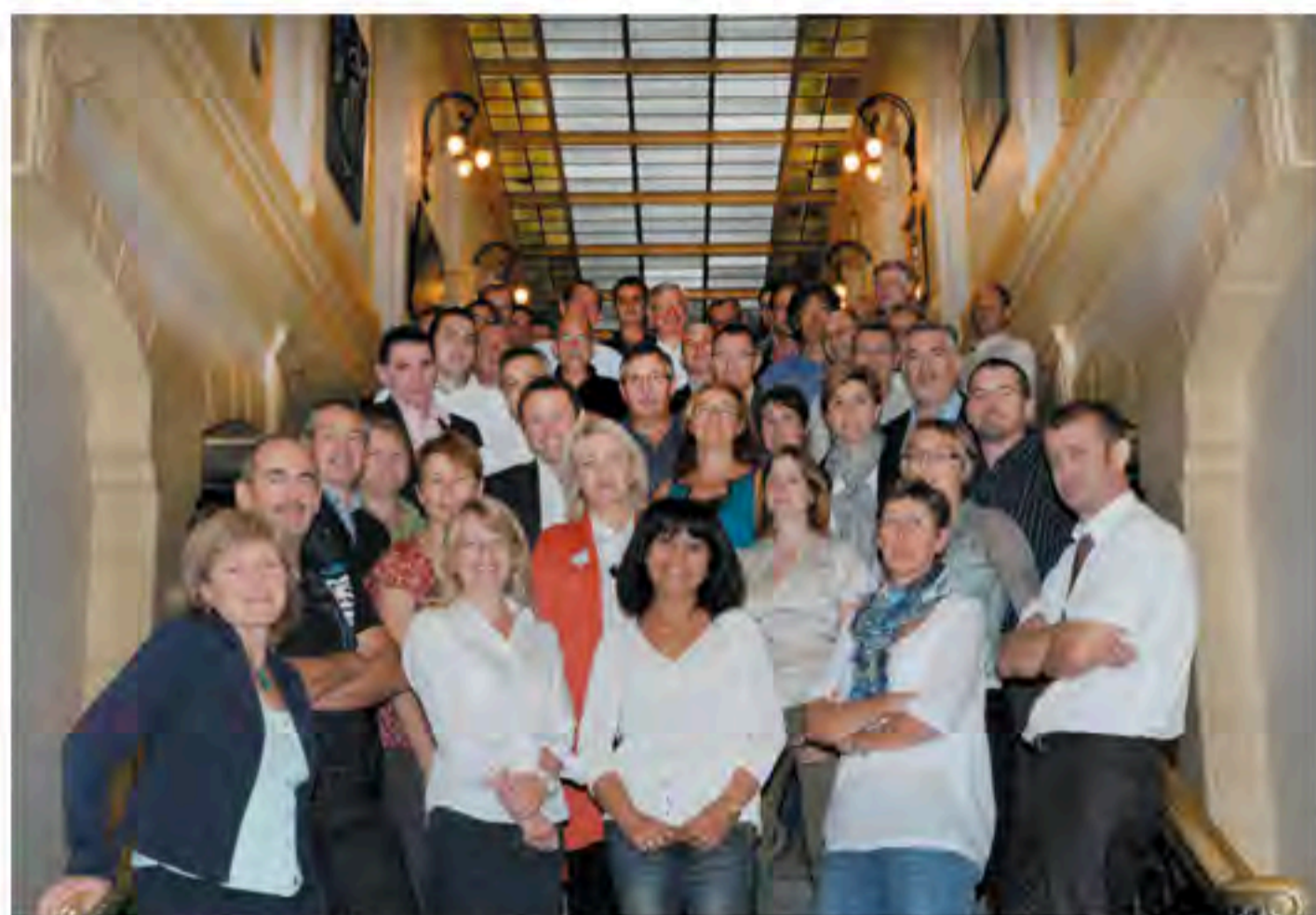
Les rencontres propreté organisées par le Grand Lyon : constructives, c'est sûr, conviviales, c'est clair !

Normaliser, puis contrôler l'efficacité des multiples actions indispensables en matière de propreté urbaine, tenait hier encore, d'une pure vue de l'esprit. En effet, conduire une démarche qualité sérieuse au sein d'une activité dont la valeur des résultats est essentiellement subjective, confinait au casse-tête. Résultat : jetant l'éponge faute de vraies solutions, certaines collectivités se résolvaient à assurer une propreté standard, conception un tantinet réductrice, et véritable pied de nez à la qualité. Seulement voilà, les IOP sont arrivés ! Non, rassurez vous, il ne s'agit pas de yaourts buvables, mais plus sérieusement, d'un concept qui pourrait bien changer la donne.